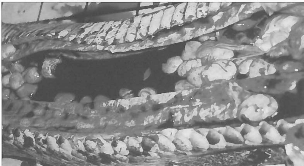
Close-up van vetophopingen waarmee het hele lichaam gevuld was.

Dit verslag schrijven we, omdat we hopen dat niemand een soortgelijke fout zal maken. In dit geval hebben de konijnen het roofdier uiteindelijk gedood. Let dus in de toekomst goed op wat je voert, het kan niet vaak genoeg gezegd worden. Hopelijk beseft ook elke lezer dat 'onze' konijnenfokker zijn ongeveer 10.000 konijnen afzet op de markt... voor onze kerstdiners.