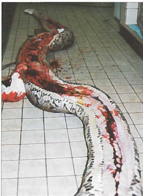
Python molurus bivittatus: aanvang sectie/lengte-aanzicht.

Eenmaal thuisgekomen, brachten we de slangen onder in een terrarium dat we al klaar hadden staan. Hun onderkomen mat 100x60x60 cm, en was voorzien van verlichting, klimgelegenheid, bodemverwarming en een waterbak die zó groot was, dat de slangen er eventueel in zouden kunnen gaan liggen.