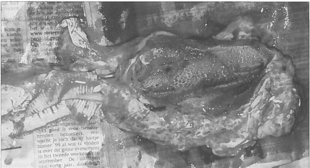
Wat er van de long over is.

bijna 80kg zie je niet iedere dag! Deze sloeg ons aanbod echter af. Daarom belden we zijn collega om het dier naar de destructor af te voeren. Karretje geleend op de zaak en het dier werd afgeleverd bij de praktijk. In dit geval troffen wij een dierenarts die reptielen een heel interessant hoofdstuk van zijn studie had gevonden, maar nooit gelegenheid had om dit uit te bouwen. Deze arts was nog nieuwsgieriger naar haar doodsoorzaak dan wij en stelde voor een kleine sectie te verrichten - kosteloos! Hij stelde ons in de gelegenheid om, gewaapend met fototoestel, aanwezig te zijn. De sectie duurde ongeveer anderhalf uur, en bevestigde onze vermoedens; een longbloeding. Maar ook iets heel anders. Het dier bleek op een abnormale manier aan vervetting te lijden. Haar hele lichaam zat vol met enorme vetklompen! Haar lever was verdwenen tussen het vet, evenals haar hart. Ook haar longen waren geel. Doodsoorzaak: een longbloeding veroorzaakt door vervetting.